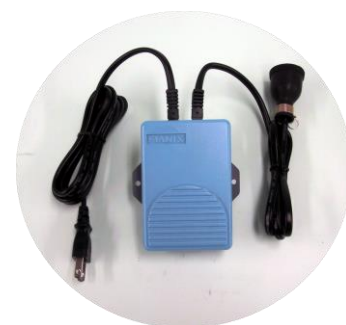
No.431 フットスイッチ 別売